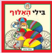
אנתוני בראון בילי האלוף [סיפורי בילי] מאנגלית: אירית ארב כנרת 2008