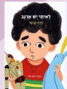
המלצה: גיל 3-5

נירה הראל לאיתי יש ארנב איורים: רונה מור זברה 2012