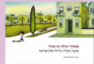
גיל-לי אלון קוריאל מאחורי הדלת יש שביל הקיבוץ המאוחד 2012

בילי הקוסם: בעזרת נעלי כדורגל קסומות מצליח בילי יותר מחבריו, ואז הנעליים נעלמות... מה יקרה כשיו? בילי וגורדי: קופיף חלשלוש פוגש בקוף גדול וחזק, ומתברר ששניהם יכולים לעזור זה לזה (מצוין); בילי האלוף: בילי לא טוב בשום דבר, ודווקא מול הבריון השכונתי... (לא משכנע).