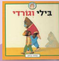
אנתוני בראון בילי וגורדי [סיפורי בילי] מאנגלית: אירית ארב כנרת 2008