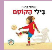
אנתוני בראון בילי הקוסם [סיפורי בילי] מאנגלית: אירית ארב כנרת 2012