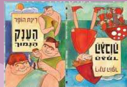
המלצה: גיל 3-5

רינת הופר הגמד הגבוה/הענק הנמוך זמורה ביתן 2012